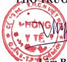
Lâm Bình Yên